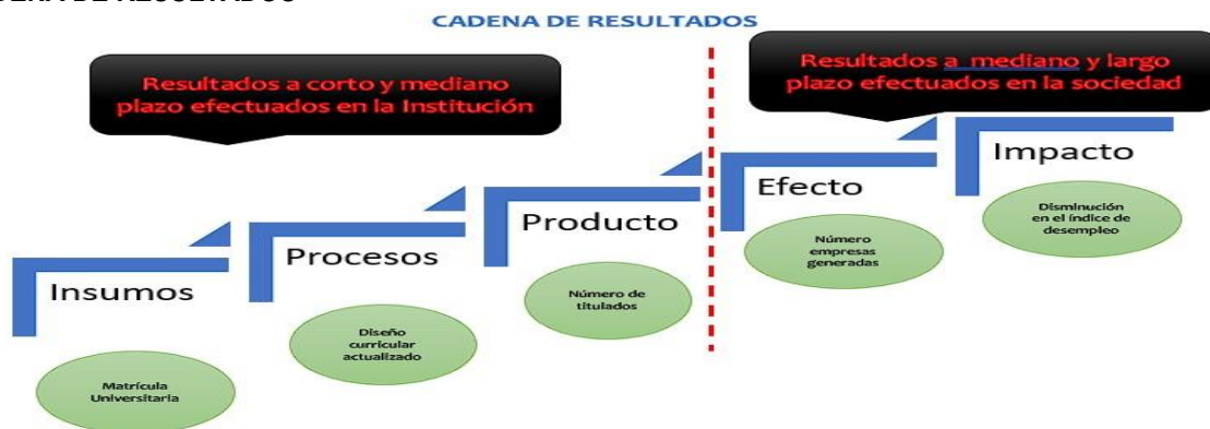
Figura No. 3 CADENA DE RESULTADOS

Como se señaló en lo Como se señaló anteriormente, los efectos deseados e impactos deseados, responden a la siguiente cadena de resultados: