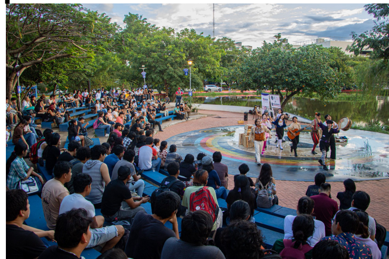
Unidad de Comunicación DEIS

La Universidad Autónoma Gabriel René Moreno inició su agenda cultural 2026 con una jornada artística en el Teatro al Aire Libre, en conmemoración del Día Mundial del Teatro.