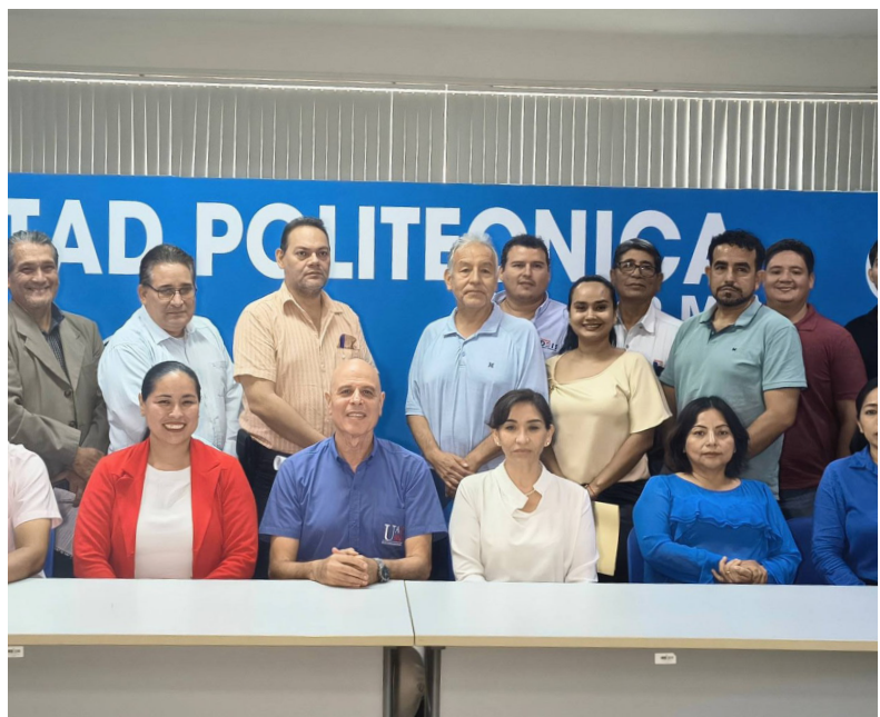
Unidad de Comunicación DEIS

La Dirección de Extensión e Interacción Social (DEIS) y la Dirección de Investigación, Ciencia, Innovación y Tecnología (DICIT) desarrollaron el primer encuentro de directores de extensión e institutos de investigación de las distintas facultades, en el marco de la implementación del nuevo