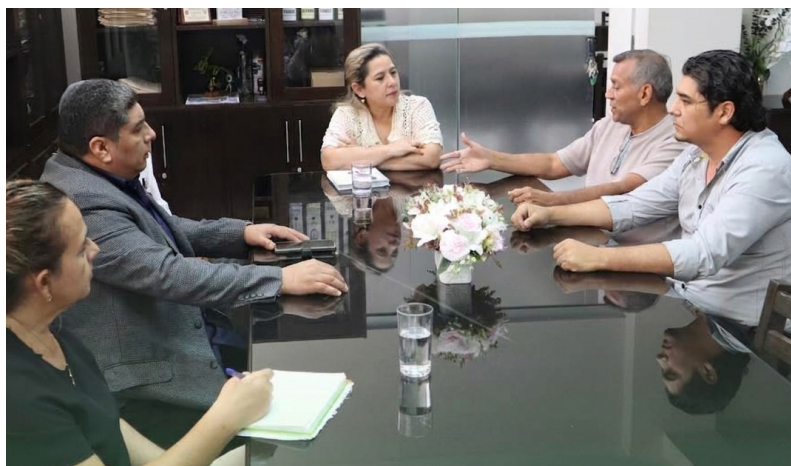
Unidad de Comunicación/ Facultad Cs. Farmacéuticas y Bioquímicas

Autoridades y representantes de la Facultad de Ciencias Farmacéuticas y Bioquímicas sostuvieron una reunión de coordinación orientada a impulsar la movilidad docente y estudiantil, a través de la gestión del Departamento de Relaciones Públicas Nacionales e Internacionales de la UAGRM.