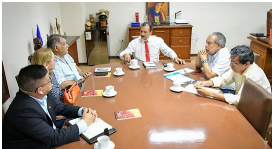
Nancy Camacho Manrique/Unidad de Comunicación DEIS

Con el propósito de brindar mejores condiciones de conservación del centro de nuestra ciudad, la Universidad Autónoma Gabriel René Moreno promovió la conformación de una comisión de profesionales que trabajará en la elaboración