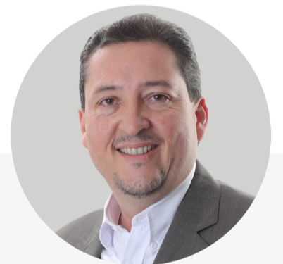
Autor: Manfredo R. Bravo Chávez Jefe del Dpto. de Relaciones Públicas Nacionales e Internacionales

Gracias al trabajo de hombres y mujeres de la Comisión Interinstitucional, sus equipos técnicos y al sacrificio del pueblo cruceño con los 36 días que duró el paro indefinido, podemos afirmar sin temor a equivocarnos que logramos el objetivo. Habrá censo en marzo de 2024 y tendremos resultados ese mismo año para su aplicación inmediata en la redistribución de recursos y de representantes parlamentarios.