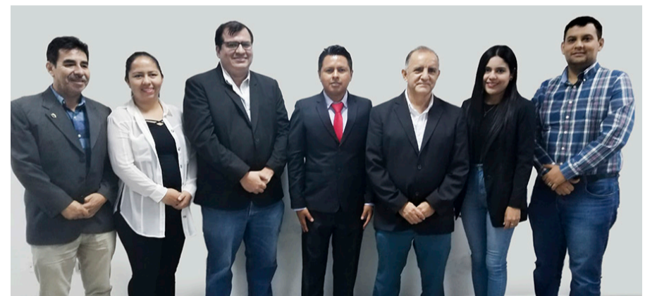
Raúl J. González Z/ Dirección de Comunicación Escuela de Ingeniería

Un estudio realizado en la Escuela de Ingeniería de la Facultad de Ciencias Exactas y Tecnología, para obtener el grado de máster en Sistemas Integrados de Gestión de Seguridad, Medio Ambiente y Calidad, demuestra que se puede aprovechar mejor los recursos maderables en determinadas zonas geográficas.