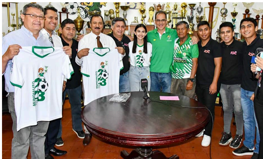
Maricruz Mendoza Ugarte/Comunicación Rectorado

La Universidad Autónoma Gabriel René Moreno y la