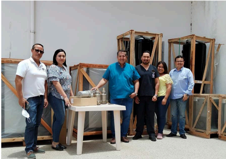
Unidad de Comunicación Facultad Ciencias de la Salud Humana

Con una inversión que supera los Bs 190 mil, provenientes de los recursos del IDH, la carrera de Odontología de la Universi-