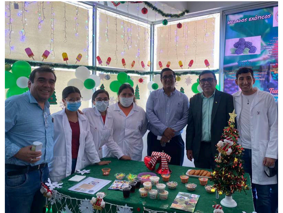
Wilma Días Guzmán/Unidad de Comunicación Fac. Ciencias Exactas y Tecnología

Con más de 40 expositores se inauguró la XXXI versión de la Feria de Investigación Fexpal, que organiza desde hace más de tres décadas la carrera de Ingeniería de Alimentos de la Facultad de Ciencias Exactas y Tecnología.