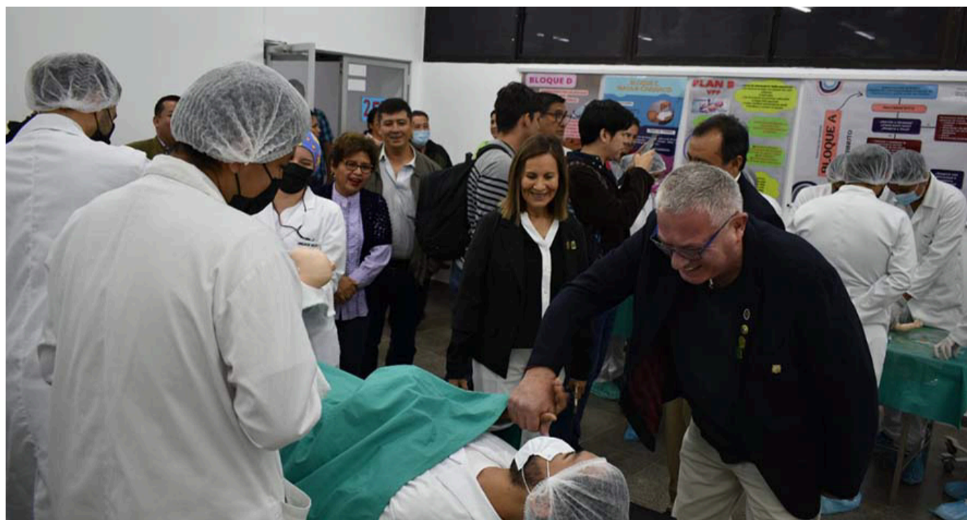
Unidad de Comunicación Facultad de Ciencias de la Salud Humana

La Universidad Autónoma Gabriel René Moreno y el Instituto de Seguridad del Paciente y la Calidad de los Servicios de Emergencia (IPAS) firmaron una adenda al convenio marco suscrito entre ambas instituciones, para desarrollar cursos de certificación de formación universitaria en servicios médicos de emergencia prehospitalaria.