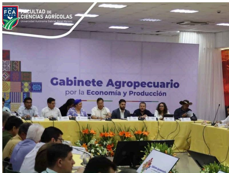
Unidad de Comunicación Fac. Ciencias Agrícolas

Con el objetivo de proporcionar información actualizada y relevante sobre el impacto de los Organismos Genéticamente Modifica-