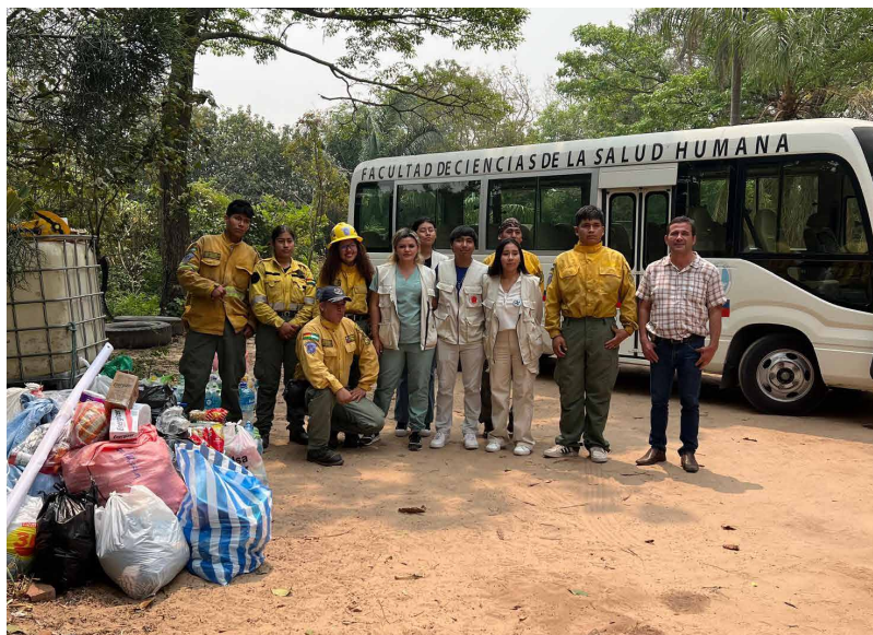
Unidad de Comunicación Fac. Ciencias de la Salud Humana