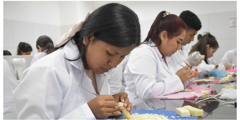
Unidad de Comunicación Fac. Ciencias de la Salud Humana

En el marco del 13.º aniversario de la carrera de Odontología de la Facultad de Ciencias de la Salud Humana de la UAGRM, los estudiantes participaron de un ingenioso concurso de tallado de piezas dentales. Esta actividad reunió a talentosos estudiantes, quienes demostraron su destreza y precisión en una de las técnicas más esenciales dentro de la práctica odontológica. Además, esta iniciativa les permitió poner en práctica sus conocimientos, habilidades y el control manual y atención al detalle, fundamentales en su