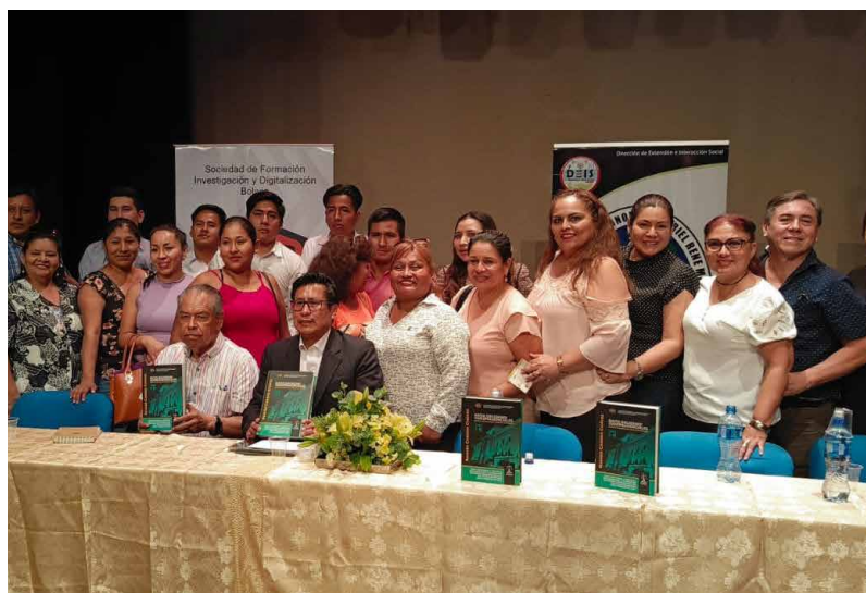
Nancy Camacho Manrique/Unidad de Comunicación DEIS

La Cátedra Bicentenario es una iniciativa académica científica que promueven la Universidad Autónoma Gabriel René Moreno y el Repositorio de la Memoria Democrática en Bolivia, en el marco del Bicentenario de la Independencia de Bolivia.