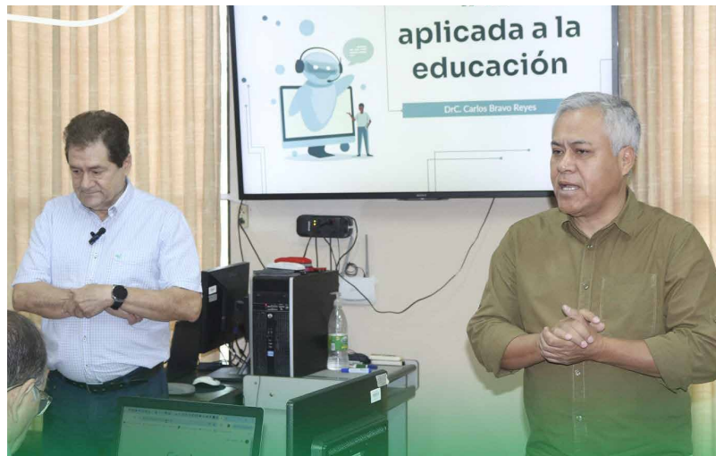
Unidad de Comunicación Fac. Ciencias Agrícolas

En la Facultad de Ciencias Agrícolas, se llevó a cabo un taller innovador enfocado en la aplicación de la inteligencia artificial (IA) en el ámbito educativo, dirigido a los docentes de la FCA. Este evento tuvo como objetivo principal capacitar a los profesores en el uso de