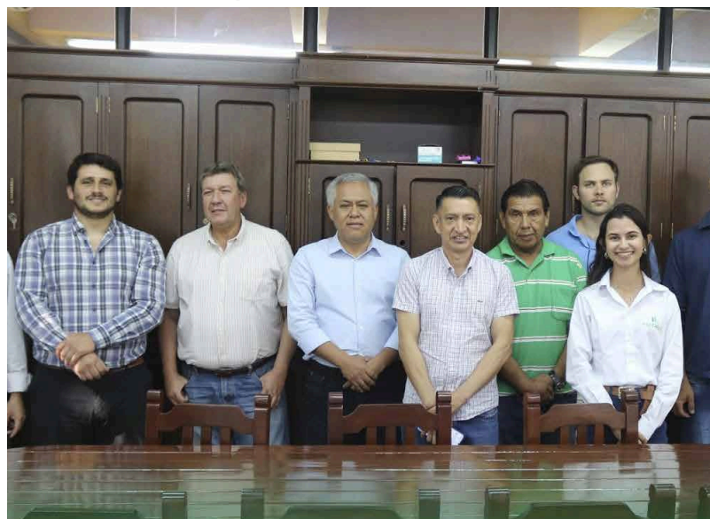
Unidad de Comunicación Fac. Ciencias Agrícolas

Las autoridades de la Facultad de Ciencias Agrícolas y del Instituto de Investigaciones Agrícolas El Vallecito se reunieron con altos ejecutivos del Grupo CREA-Bolivia y dos docentes expertos de la Universidad de Buenos Aires (UBA) y de la Universidad Federal de Goiás (UFG) de Brasil para coordinar la realización de proyectos en el área