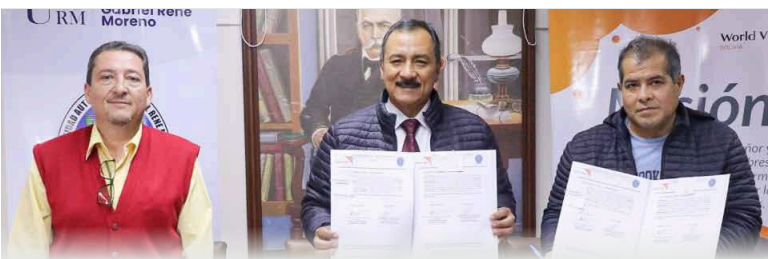
UAGRM y Visión Mundial firmaron convenio en beneficio de niños y jóvenes