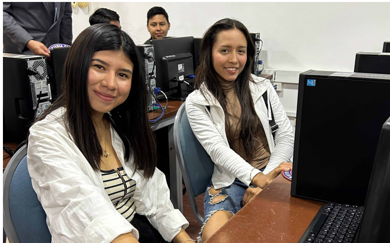
Mariela Sánchez /Unidad de Comunicación Fac. Ciencias Económicas y Empresariales

En un esfuerzo por mejorar la calidad educativa y brindar a los estudiantes las herramientas necesarias para su formación profesional, la Facultad de Ciencias Económicas y Empresariales de la Universidad Autónoma Gabriel René Moreno ha inaugurado nuevas y modernas salas de cómputo