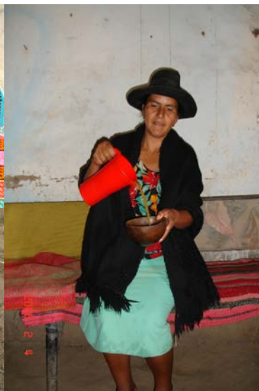
CHICHA DE MAÍZ