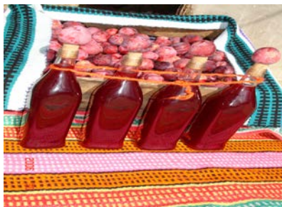
VINOS Y CARONAS